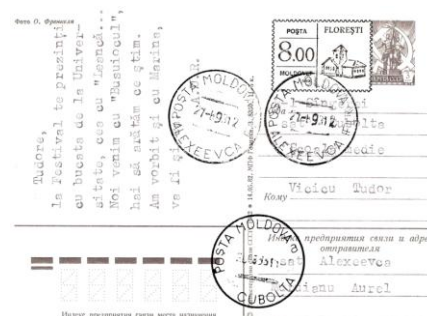
Carte postale illustrée 3 kop. affranchie avec le cachet timbre-poste POȘTA 8.00 MOLDOVEI 1993 FLOREȘTI, expédiée le 27.08.1993

La valeur nominale de 12.00 (roubles) a eu la dimension de l’empreinte de: 26.5 x 20.0 mm (Tiraspol, type 1), 32.0 x 23.0 mm (Anenii Noi, type 2; Bălți, type 2; Cahul, type 2; Călărași, type 2; Chișinău, type 1; Criuleni, type 2; Dondușeni, type 2; Drochia, type 2; Dubăsari, type 2; Edineț, type 2; Fălești, type 2; Florești, type 2; Glodeni, type 2; Râbnița, type 1; Sângerei, type 1; Soroca, type 1; Tiraspol, type 1; Vulcănești, type 1), 35.0 x 25.0 mm (Căinari, type 2; Căușeni, type 2; Ciadâr-Lunga, type 2; Cimișlia, type 2; Comrat, type 2), 35.0 x 25.5 mm (Camenca, type 2; Ocnîța, type 1; Rezina, type 1), 36.0 x 25.0 mm (Briceni, type 2). Appliquées avec l’inscription „POȘTA 12.00 MOLDOVEI 1993 et le nom de la localité”.