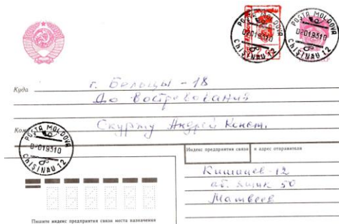
Entier postal soviétique 5 kop. (1990) affranchi avec la cachet timbre-poste POȘTA MOLDOVA 1993 CHIȘINĂU 2.95, encre rouge, expédié le 02.01.1993, premier jour d’emploi