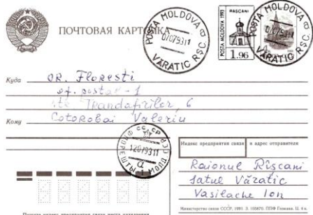
Carte postale de 4 kop. affranchie avec le cachet timbre-poste POȘTA MOLDOVA 1993 RÂȘCANI 1.96, expédiée le 12.07.1993 de le village VĂRATIC, dans le district RÂȘCANI

La valeur nominale de 1.96 (roubles) fut appliquée sur des cartes postales à la valeur de 4 kop. afin de couvrir le tarif de 2 roubles pour une carte postale (fig. 10 & 11). La dimension de l’empreinte était de: 15.0 x 24.5 mm, sauf pour Căinari, Călărași (15,0 x 23,0 mm) et Vulcanesti (15,5 x 26,0). L’inscription était: „POȘTA MOLDOVA 1993 et le nom de la localité 1.96”.