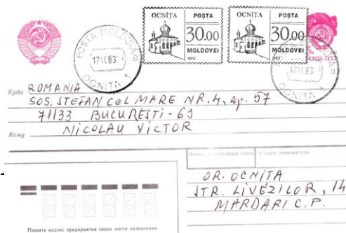
Entier postal soviétique 5 kop. (1990) affranchi avec deux cachets timbre-poste POȘTA 30.00 MOLDOVEI 1993 OCNITA, expédié le 171093

La valeur nominale de 30.00 (roubles) a eu la dimension de l’empreinte de: 28.0 x 20.0 mm (Soroca, type 1), 32.0 x 23.0 mm (Anenii Noi, type 2; Bălți, type 2; Bender type 1; Cahul, type 2; Călărași, type 2; Chișinău, type 1; Criuleni, type 1 și 2; Dondușeni, type 2; Drochia, type 2; Dubăsari, type 2; Edineț, type 2; Fălești, type 2; Florești, type 2; Glodeni, type 2; Grigoriopol, type 1; Soroca, type 1; Tiraspol, type 1), 35.0 x 25.0 mm (Briceni, type 2; Cantemir, type 2; Căinari, type 2; Căușeni, type 2; Comrat, type 2; Ocnita, type 1), 35.0 x 26.0 mm (Camenca, type 2; Ciadâr-Lunga, type 2; Cimișlia, type 2). Appliquées avec l’inscription „POȘTA 30.00 MOLDOVEI 1993 et le nom de la localité”.