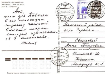
Carte postale illustrée 4 kop. affranchie avec le cachet timbre-poste POȘTA MOLDOVA 1993 CHIȘINĂU 1.97, encre bleu, expédiée le 21.05.1993

La valeur nominale de 1.97 (roubles) fut appliquée sur des cartes postales illustrées à la valeur de 3 kop. afin de couvrir le tarif de 2 roubles pour une carte postale illustrée (fig. 12). La dimension de l’empreinte était de: 15.5 x 24.5 mm (Chişinău), 16.5 x 24.5 mm (Bălţi, Tiraspol). L’inscription était : „POȘTA MOLDOVA 1993 et le nom de la localité 1.97”. Pour toutes les trois localités on connaît des pièces avec des empreintes réalisées avec de l’encre de différentes couleurs: noir, bleu, et rouge.