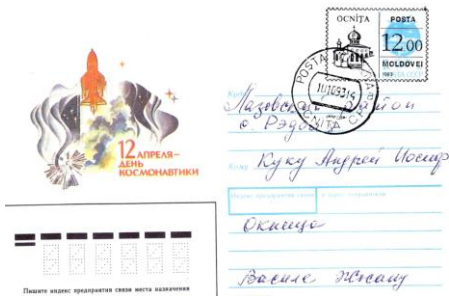
Entier postale 7 kop. (13.12.91) affranchi avec la cachet timbre-poste POȘTA 12.00 MOLDOVEI 1993 OCNITA, expédié le 10.10.1993, tirage 65 pièces!