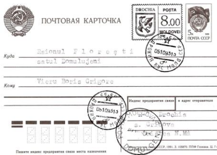
Carte postale 5 kop. affranchie avec le cachet timbre-poste POȘTA 8.00 MOLDOVEI 1993 DROCHIA, expédiée le 05.10.1993, tirage 100 pièces!

La valeur nominale de 8.00 (roubles) a eu la dimension de l’empreinte de: 21.0 x 18.0 mm (Dubăsari, type 2), 31.0 x 22.0 mm (Edineț, type 1), 32.0 x 22.5 mm (Bălți, type 2; Călărași, type 1; Edineț, type 1; Fălești, type 2; Glodeni, type 1; Hâncești, type 1), 32.0 x 22.0 mm (Dubăsari, type 2, Florești, type 2), 32.5 x 23.0 mm (Anenii Noi, type 1; Bălți, type 1; Chișinău, type 1; Drochia, type 1; Nisporeni, type 1; Ocnîța, type 1), 32.0 x 23.5 mm (Sângerei, type 1; Tiraspol, type 1), 32.0 x 25.0 mm (Cahul, type 1), 35.0 x 24.0 mm (Comrat, type 2), 35.0 x 25.0 mm (Basarabeasca, type 2; Cantemir, type 2; Căușeni, type 2; Cimișlia, type 2; Rezina, type 1), 35.5 x 25.5 mm (Camenca, type 2; Căinari, type 2; Ciadâr-Lunga, type 2), 36.0 x 25.0 mm (Briceni, type 2). Appliquées avec l’inscription „POȘTA 8.00 MOLDOVEI 1993 et le nom de la localité”.