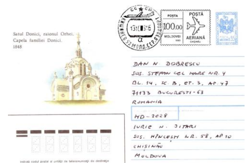
Entier postal 0.35 (24.07.92) affranchi avec la cachet timbre-poste POȘTA 100.00 MOLDOVEI 1993 POȘTA AERIANĂ CHIȘINĂU, expédié le 13.10.1993

La valeur nominale de 100.00 (roubles) a eu la dimension de l’empreinte de 32.0 x 23.0 mm. Appliquées avec l’inscription „POȘTA 100.00 MOLDOVEI 1993 POȘTA AERIANĂ CHIȘINĂU”.