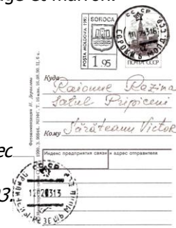
Carte postale illustrée 5 kop. affranchie avec le cachet timbre-poste POȘTA MOLDOVA 1993 SOROCA 1.95, expédiée le 10.02.1993. Tirage 100 pièces!

La valeur nominale de 1.95 (roubles) fut appliquée sur des cartes postales illustrées à la valeur de 5 kop. afin de couvrir le tarif de 2 roubles pour une carte postale illustrée (fig. 9). La dimension de l’empreinte était de 16.0 x 25.0 mm. L’inscription était „POȘTA MOLDOVA 1993 SOROCA 1.95”.