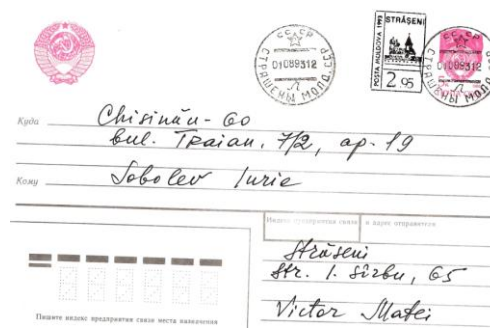
Entier postal soviétique 5 kop. (1990) affranchi avec le cachet timbre-poste POȘTA MOLDOVA 1993 STRĂȘENI 2.95, expédié le 01.08.1993, dernier jour d’emploi