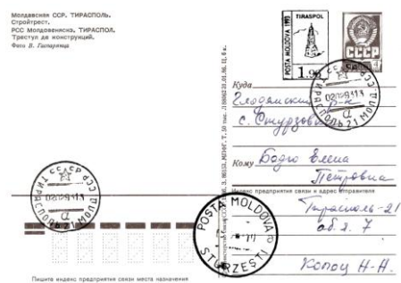
Carte postale illustrée de 4 kop affranchie avec le cachet timbre-poste POȘTA MOLDOVA 1993 TIRASPOL 1.96, expédiée le 02.02.1993, tirage 600 pièces!