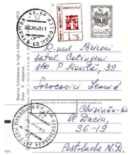
Carte postale illustrée de 0.25 roubles, affranchie avec le cachet timbre-poste POȘTA MOLDOVA 1993 CHIȘINĂU 1.75, encre rouge, expédiée le 02.08.1993

La valeur nominale de 1.75 (roubles) fut appliquée sur des cartes postales illustrées à la valeur de 0.25 (roubles) afin de couvrir le tarif de 2 roubles pour une carte postale illustrée (fig. 8). La dimension de l’empreinte était de 15.5 x 24.5 mm. L’inscription était „POȘTA MOLDOVA 1993 CHIȘINĂU 1.75”. On connaît ces pièces avec des empreintes réalisées avec de l’encre de différentes couleurs: noir, bleu, rouge et marron.