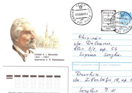
Entier postal soviétique 5 kop. (27.11.90) affranchi avec la cachet timbre-poste POȘTA 0.60 MOLDOVA 1992, expédié le 01.02.1992, premier jour d'emploi