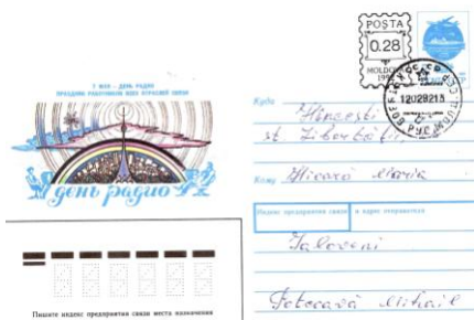
Entier postal soviétique 7 kop. (13.12.1991) affranchi avec la cachet timbre-poste POȘTA 0.28 MOLDOVA 1992, expédié le 12.02.1992