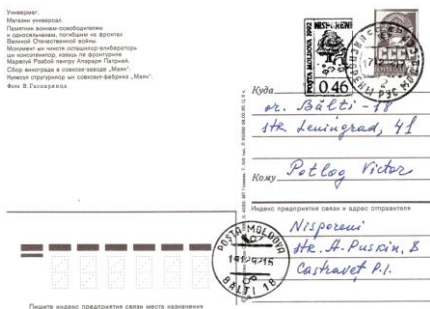
Carte postale illustrée 4 kop. affranchie avec la cachet timbre-poste POȘTA MOLDOVA 1992 NISPORENI 0.46, expédié le 17.12.1992