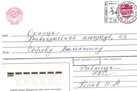
Entier postal soviétique 5 kop. (1990) affranchi avec la cachet timbre-poste POȘTA MOLDOVA 1993 RÎBNIȚA 2.95, expédié le 02.05.1993, tirage 450 pièces!

La valeur nominale de 2.95 (roubles) fut appliquée, sur des entiers postaux à la valeur de 5 kop. afin de couvrir le tarif de 3 roubles pour une lettre interne ayant un poids jusqu’à 20 gr (fig. 13, 14, 15 & 16). La dimension de l’empreinte était de: 15.5 x 24.5 mm (exception: Bălţi, Bender, Cahul, Călărași, Căușeni, Chişinău, Donduşeni, Edineț, Vulcănești), 15.5 x 26.0 mm (Bălţi, Bender, Cahul, Călărași, Căușeni, Chişinău, Donduşeni, Edineț, Vulcănești). Appliquées avec l’inscription „POȘTA MOLDOVA 1993 et le nom de la localité 2.95”. Pour CHIȘINĂU, on connaît des pièces avec des empreintes réalisées en: encre noir, bleu, rouge et brun.