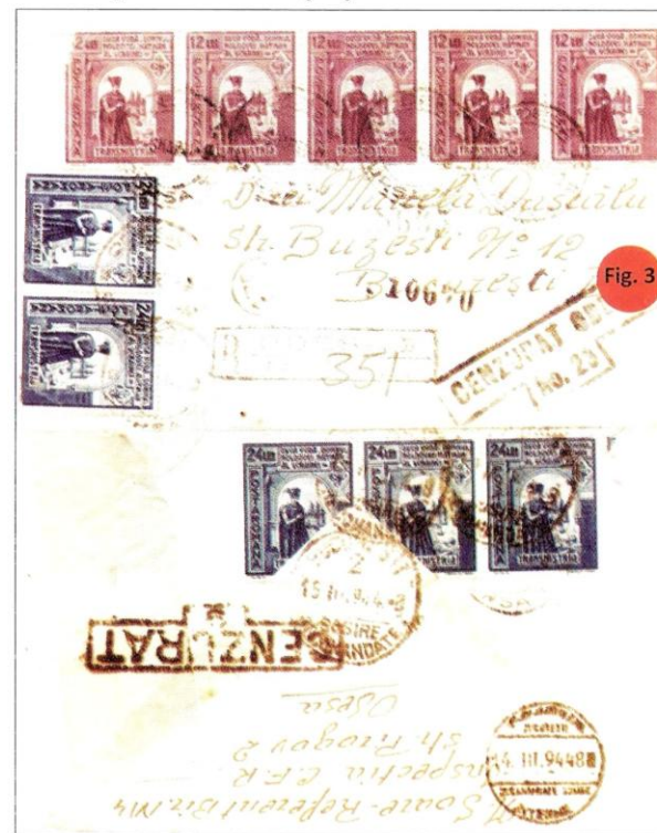
Fig. 10: Scrisoare recomandată cenzurată, expediată de la Odesa la București pe 3 martie 1944 - dată foarte târzie (colecția Em. Săvoiu).

The offices for postal censorship Berezovca and Oceacov were