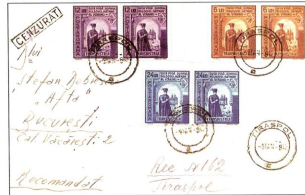
Fig. 3 - Scrisoare cenzurată, expediată recomandat din Tiraspol la București, francată filatelic, dar circulată efectiv. Fig. 3 - Registered censored letter sent from Tiraspol to Bucharest, philatelic franking, effectively circulated

From the summer of 1942 the post offices of Transnistria got the approval to receive the postal correspondence for all the al- ▶▶▶