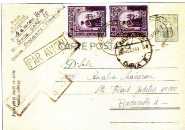
Fig. 5 - Carte poștală cenzurată, expedită prin avion din Oceaov la București pe 12 iunie 1943 Fig. 5 - Censored Post card sent by flight from Oceaov to București on May the 12 th 1943

De la 7 iulie 1942 legătura aeropoștală se făcea prin cursa poștală aeriană BUCUREȘTI-IAȘI-CHIȘINĂU-TIRASPOL, prelungită la 28 iulie până la Odesa printr-o cursă locală. Tot de la 28 iulie 1942 s-a înființat și o cursă poștală aeriană directă BUCUREȘTI-IAȘI-CHIȘINĂU-TIRASPOL-ODESA și retur, care a funcționat până la