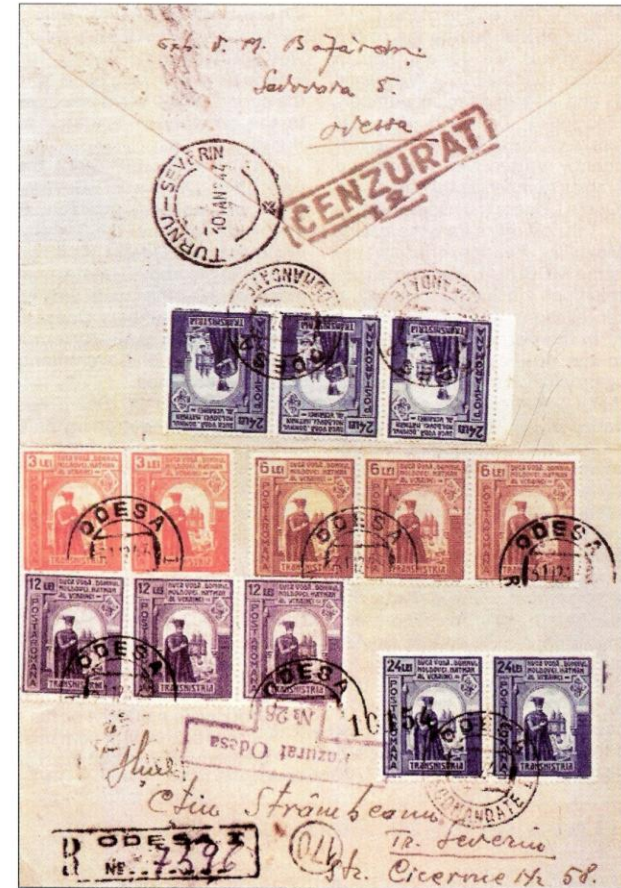
Fig. 4 - Scrisoare recomandată cenzurată, expediată din Odessa la T. Severin pe 31 dec. 1943, francată cu mărci postale transnistrene de 3 lei (Colecția Em. Săvoiu).