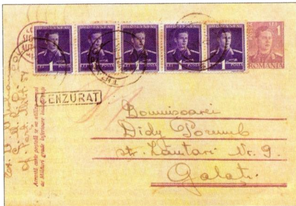
Fig. 1 - Carte poștală militară românească de 1 leu expedită pe 19 oct. 1941 din Tiraspol la Galați.

În anul 1681 Duca Vodă avea sub stăpânire sa întreg ținutul dintre Carpați și Nipru, devenind domn al Moldovei și hatman al Ucrainei. În anul 1774, în timpul împărătesei Ecaterina a II-a, Imperiul rus s-a întins până la Bug și abia în anul 1792, prin pacea de la Iași dintre ruși și turci, Transnistria a trecut sub ocupație rusească. Moldovei i-a rămas doar un mic teritoriu, cuprinzând orașul Moghila (fondat de voievodul moldovean Ieremia Movilă). Acest teritoriu a trecut sub ocupație rusească în anul 1812, odată cu străbunul pământ românesc Basarabia.