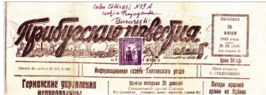
Fig. 9: Ziarul "Pribugskie Izvestia" expedit din Golta către București pe 18 iunie 1943.

«1. Pe corespondența prezentată la oficiul poștal Tulcin se aplică atât ștampila oficiului ▶▶▶