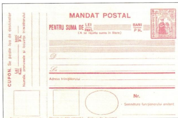
Fig. 7 - Mandat poștal transnistrian cu marca poștală fixă de 9 lei Fig. 7 - Transnistrian postal payment order form with printed postage stamp of 9 lei

specified a run printing of 50,000 series. These postage stamps were sold, according to the directives, only in complete sets at the post offices from Transnistria and to the Transnistrian exhibition until November 30 th , 1942, when they were withdrawn from circulation. The stamps of this issue had franking validity also only for the mail posted and delivered from Transnistria, in Romania being sold to the philatelists only.