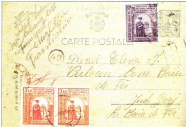
Fig. 8: Carte poștală cenzurată expedită din Moghilău la Baia de Fier - Județul Gorj, pe 9 feb.1944, francată cu mărci poștale transnistrene de 3 lei.

Birourile de cenzură a corespondenței Berezovca și Oceacov au fost înființate în conformitate